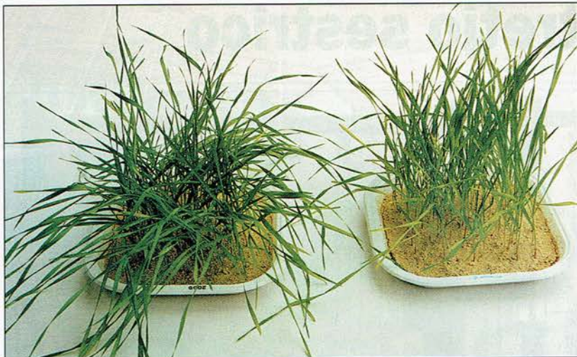
Kaljenje pšenice pokaže vitalno moč vode iz kozarca, saj zrna, zalivana z vodo iz kozarca, poženejo večja, močnejša in bolj zelena stebela.

hkrati rezultat pokaže, kako je voda primerna za človeka in živali. Biolog v preiskovano vodo nasadi čebulice, te v 72 urah poženejo nove koreninice, celice teh koreninic pa pregledajo pod mikroskopom in preštejejo, v kolikih mitoznih celicah so snovi v vodi, odkrite in neodkrite, poškodovale kromosome, nosilce dednih zapisov. Deset odstotkov poškodovanih kromosomov kaže še na relativno kakovostno vodo, 48 odstotkov poškodovanih celic, kolikor jih, na primer, poškoduje voda Kamniške Bistrice v Biščah, pa že napovedujejo tako slabo vodo, da naj z njo ne bi bilo dovoljeno zalivati niti dreves, kaj šele zelenjave. Toda tudi Zala poškoduje kar vsako četrto celico, natančneje je lom kromosomov te vode 25,92-odstoten. To pa je veliko v primerjavi z vodovodno vodo, ki denimo v Domžalah poškoduje 12,19, v Ljubljani 15,53 ter v v Celju 18,75 odstotka kromosomov. Če pa vodo natočimo v informirani kozarec, se vodi iz ljubljanskega vodovoda zmanjša genotoksičnost na zgolj 10,76, vodi iz celjskega vodovoda pa na 11,76 odstotka. Torej je vodo-