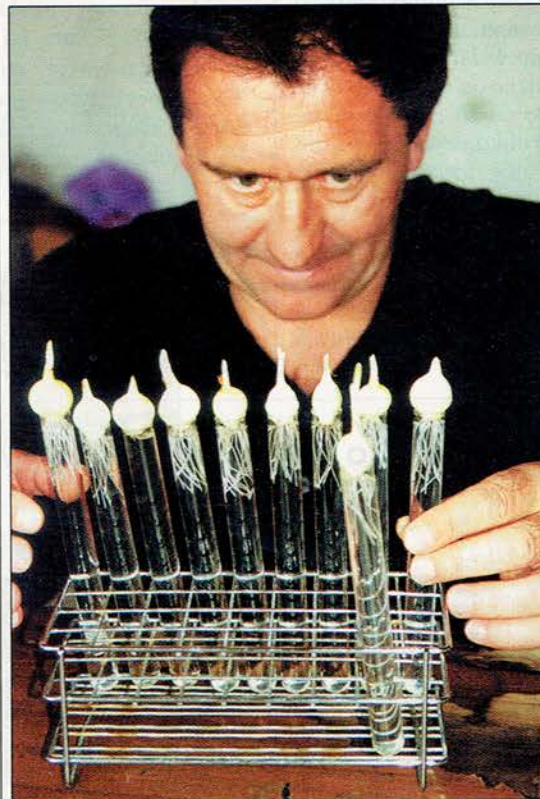
Čebulni testi neprizanesljivo kažejo kakovost vode in se razlikujejo od kemičnih po tem, da pokažejo celokupen učinek onesnaževanja in ne le prisotnost tistih snovi, ki jih kemiki s svojimi metodami iščejo.

Tisti z najbolj izostrenim okusom sicer zaznajo že spremembo okusa vode, ki takoj, ko jo natočimo v kozarec, postane meh-