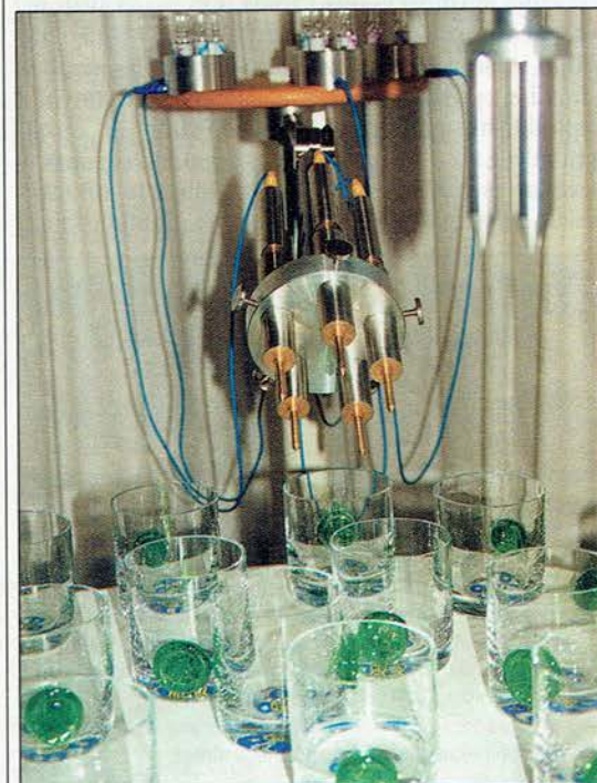
V kozarce v celjskem laboratoriju vsevajo skrbno izbrane informacije s pomočjo organskih sevalnikov.

Čebulni test pokaže, kako kakovostna je voda za življenje čebule, toda