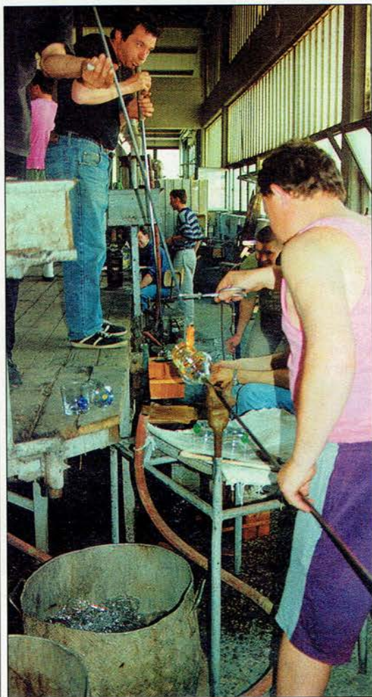
Kozarce ročno izdelujejo iz posebnega kristalina v Steklarški šoli v Rogaški Slatini.

2000 (to je modri kozarec, ki se mu je pridružil še zeleni z dodatnimi informacijami, ki lajšajo hujšanje, in rdeči, ki je namenjen pitju vode za zmanjšanje bolezenskega stresa), se prijazno odzivajo tudi živali in rastline. V severnem delu Slovenije že teče veterinarska raziskava, ki kaže obetavne rezultate, to je zmanjšanje porabe veterinarskih zdravil in ugoden vpliv na obnašanje živali.