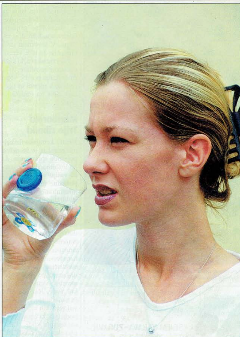
Pitje informirane vode blagodejno vpliva na zdravje.

Kozarec 2000, zaradi modrega emblema je dobil ime modri kozarec, je nastal že pred dvema letoma. Ob raziskavah revije Misteriji o vplivu informacij, bodisi bioterapevtskih, bodisi snovnih, posredovanih in ojačanih s pomočjo organskega sevalnika, je mikrobiologu na ljubljanskemu