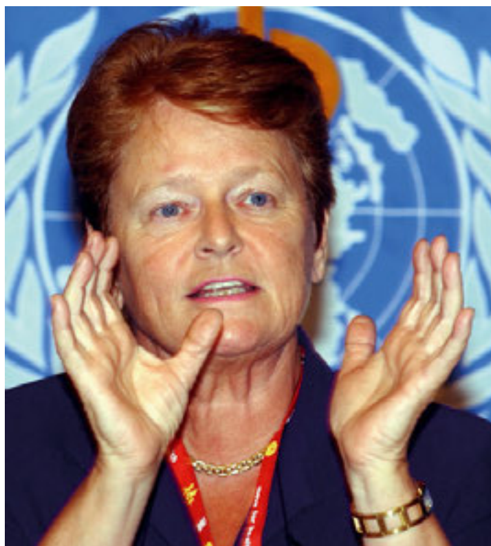
Doktorica medicine Harlem Brundtland, prejšnja direktorica Svetovne zdravstvene organizacije, je v njeni pisarni v Ženevi prepovedala uporabo brezžičnih telefonov – iz izključno zdravstvenih razlogov.

Z naglim porastom radijskih stolpov in osebnih oddajnikov je vsaj tretjina svetovne populacije nenehno obsevana z elektromagnetnimi valovanji različnih dolžin in jakosti. Kako nevarna je množična izpostavljenost sevanju, potrjuje rezul-